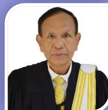
เหรียญกษาปณ์ นายอำนาจ พวงชมพู