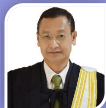
รองเลขาธิการ หม่อมหลวงศุภกิตต์ จรูญโรจน์