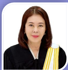
อุปนายก คนที่ ๑ นางสุวิชา นาควัชระ