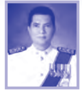
วรพจน์ อินทวดี* มนต์ชัย ชนินทรลีลา** สุรพร ชลสาคร***

ตามพระราชบัญญัติประกันสังคม พ.ศ. ๒๕๓๓ มาตรา ๕ และพระราชบัญญัติเงินทดแทน พ.ศ. ๒๕๓๗ มาตรา ๕ บัญญัติว่า “ค่าจ้าง” หมายความว่า “เงินทุกประเภทที่นายจ้างจ่ายให้แก่ลูกจ้างเป็นค่าตอบแทนการทำงานในวันและเวลาทำงานปกติไม่ว่าจะคำนวณตามระยะเวลาหรือคำนวณตามผลงานที่ลูกจ้างทำได้ และให้หมายความรวมถึงเงินที่นายจ้างจ่ายให้ในวันหยุดและวันลาซึ่งลูกจ้างไม่ได้ทำงานด้วย ทั้งนี้ ไม่ว่าจะกำหนด คำนวณหรือจ่ายในลักษณะใด หรือโดยวิธีการใด และไม่ว่าจะเรียกชื่ออย่างไร” ๑