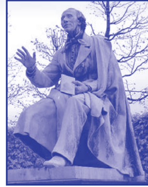
ฮันส์ คริสเตียน แอนเดอร์เซน

(เดนมาร์ก: Hans Christian Andersen; ค.ศ. ๑๘๐๕-๑๘๗๕)