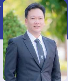
พระพิพัฒน์ อิงพงษ์พิพัฒน์ (๑)