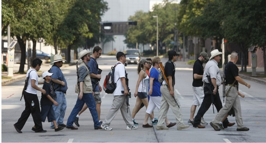
มานิตย์ จุมปา รัฐธรรมนูญ เนติฯ ๒๕๖๐

http://www.chron.com/news/houston-texas/texas/article/Texas-Open-Carry-gun-advocate-Walmart-worker-6801297.php