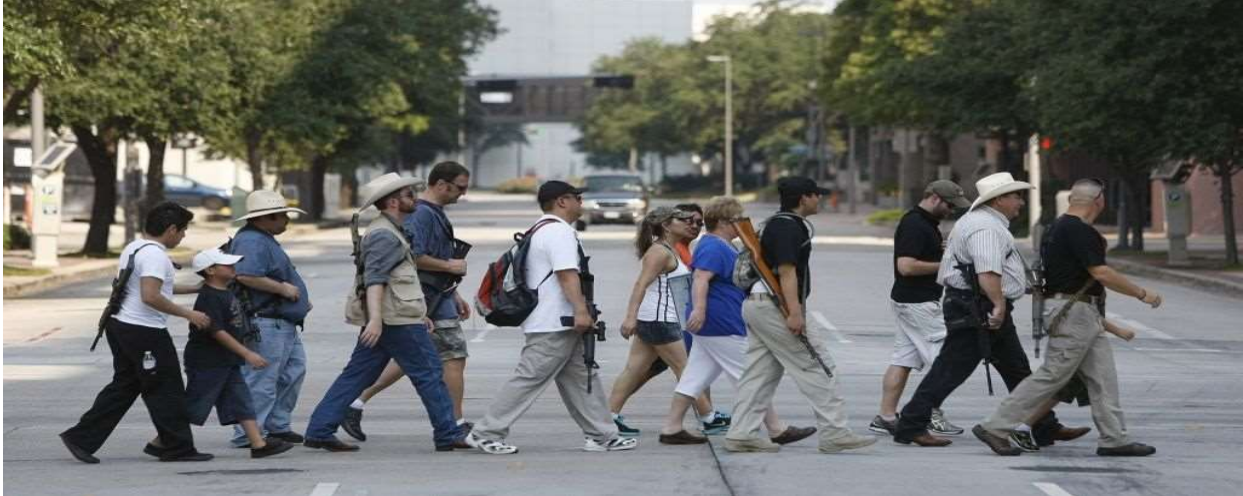
มาดิสต์ จุงเป่า รัฐธรรมบัญญัติ ๒๐๑๖

http://www.chron.com/news/houston-texas/texas/article/Texas-Open-Carry-gun-advocate-Walmart-worker-6801297.php