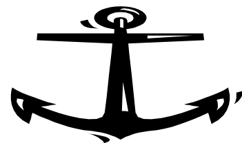
มาดิสต์ จุงเป่า รัฐธรรมบัญญัติ ๒๐๑๖